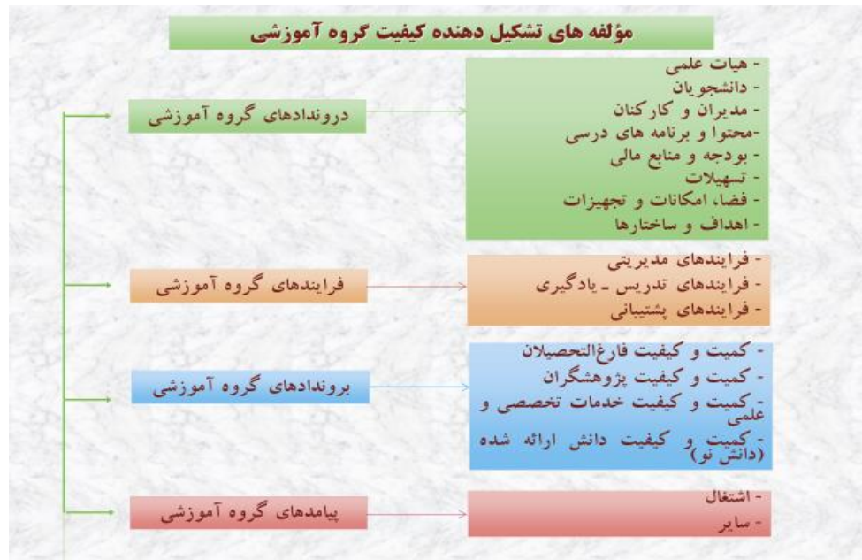
نمودار (2) بیانگر عوامل مورد ارزیابی در گروه آموزشی

پس از تعیین عوامل مورد ارزیابی، لازم است اجزای هر عامل تدوین شود. برای نمونه اگر کمیته ای ارزیابی گروه آموزشی فیزیک در دانشکده ای علوم، « تدریس و آموزش» را به عنوان یک عامل مورد ارزیابی در نظر گرفته باشد، اجزای این عامل می تواند شامل موارد زیر باشد: کیفیت تدریس، ارتباط بین فردی، استفاده از فناوری اطلاعات و ارتباطات ارزشیابی درس.